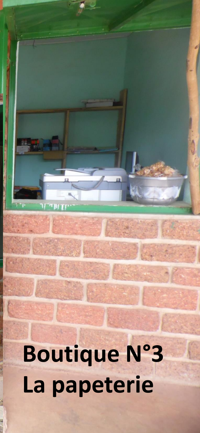
Boutique N°3 La papeterie