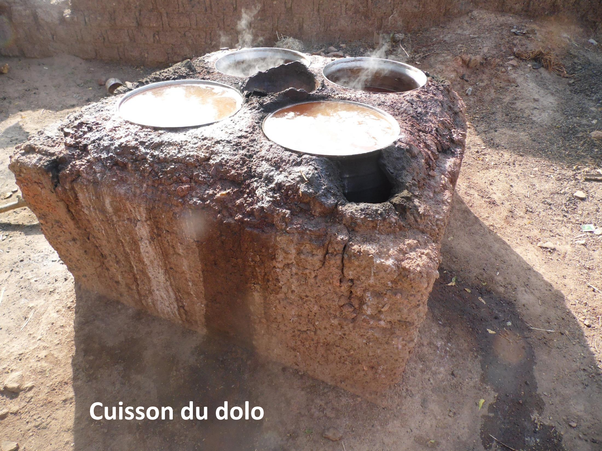
Cuisson du dolo