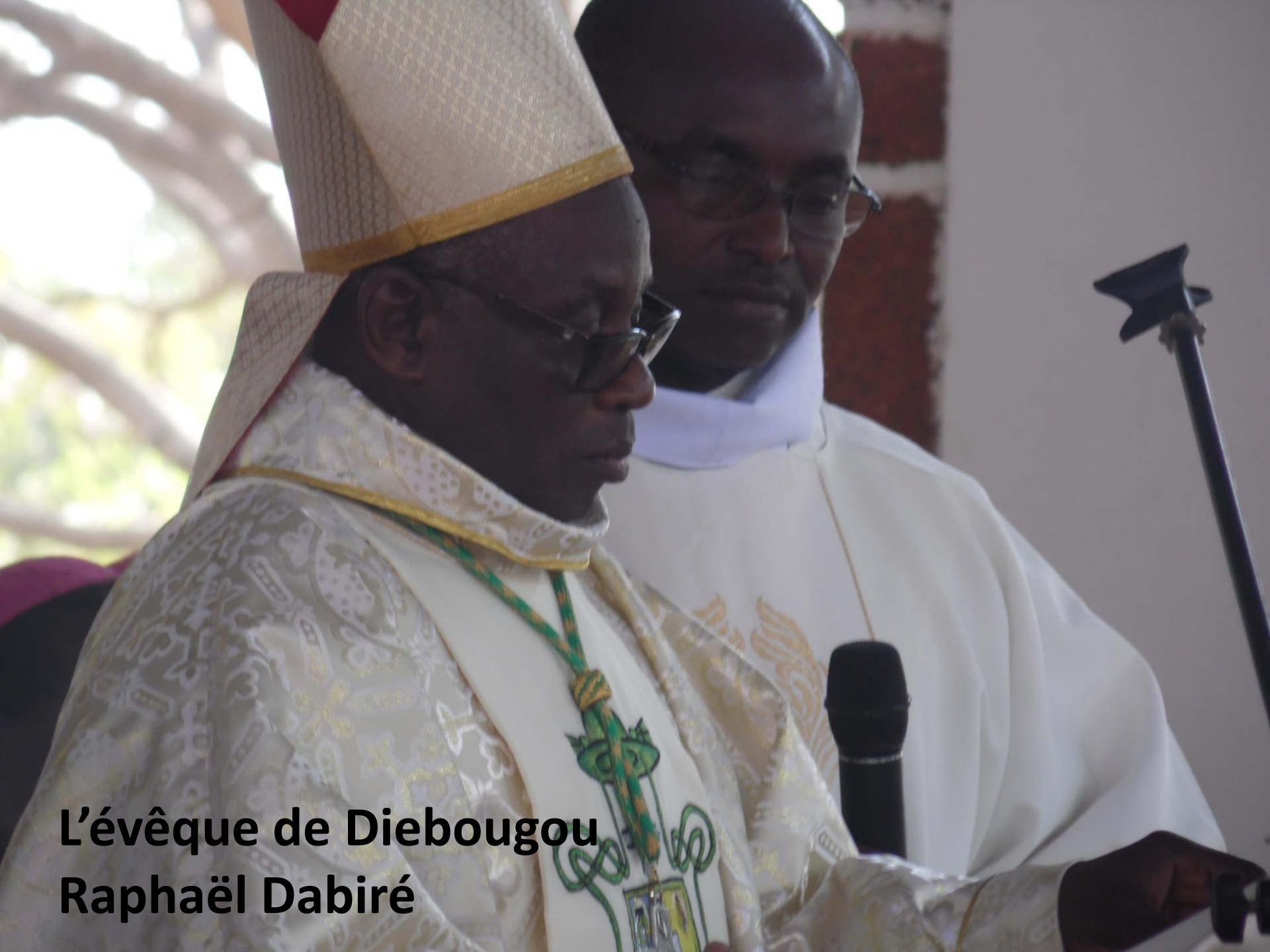
L'évêque de Dieboukou Raphaël Dabiré