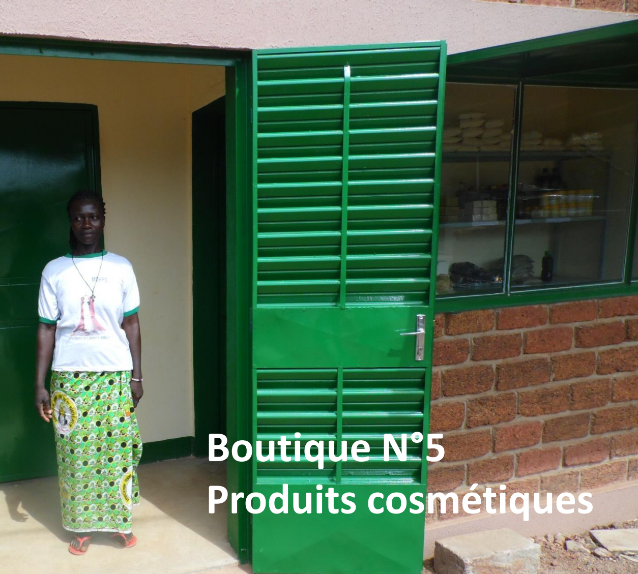
Boutique N°5 Produits cosmétiques