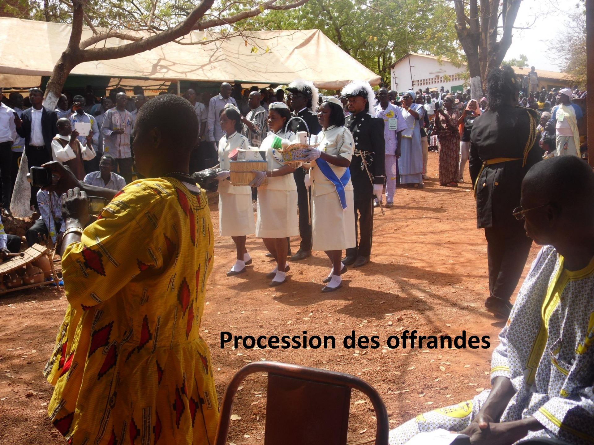
Procession des offrandes